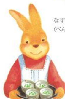
なずな (べんべん草)