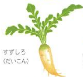
すずしろ (だいこん)