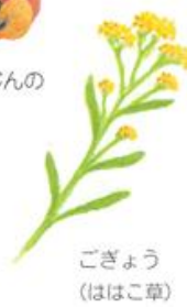
ごぎょう (ははこ草)